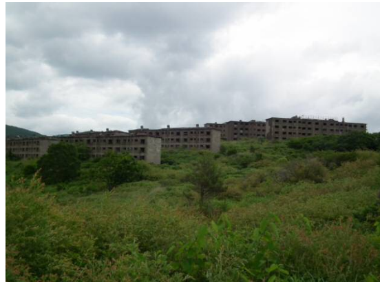
廃墟となっている旧松尾鉱山団地。最盛期は15,000人が生活していたそうです。