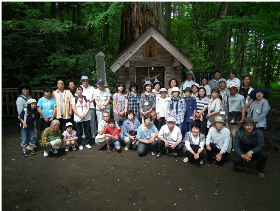
参加した皆さんと弓弭の泉の前で記念撮影

水道事業所では、今後も水の安全安心な水をお届けするとともに、各種事業を通じ市民の皆様へ水への関心などについて普及・啓発に努めてまいります。