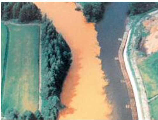
松尾鉱山閉山当時の松川と北上川の合流点

この施設で旧松尾鉱山から流出する強酸性水の中和処理をおこなっています。中和処理後に放流することにより、北上川の水質が保たれています。