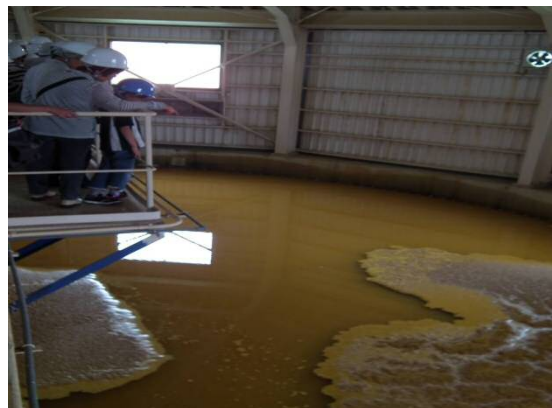
処理中の強酸性水がバクテリアの活動によって処理されていきます。