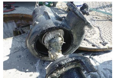
▲マンホールポンプに詰まった不織布等

【問い合わせ先】 登米市上下水道部 経営総務課 TEL 0220(52)3313 (令和6年9月1日発行) Mail:suidosomu@city.tome.miyagi.jp ホームページ ▶tome-suido.com