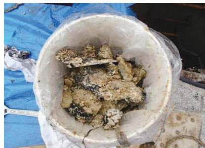
▲下水道管内で冷えて固まった油