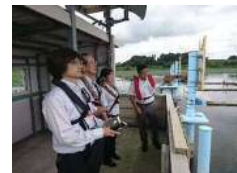
ボートスタート地点

水道事業所では、事業への理解を深めていただくため、今後も積極的な情報発信に努めます。