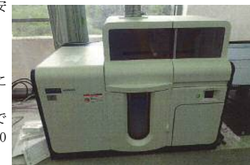
更新した原子吸光度計