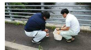
採水を行っている様子