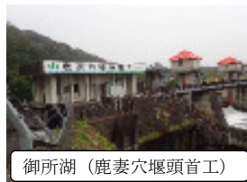
御所湖(鹿妻穴堰頭首工)

10月10日(火)に北上川の水質調査の一環として上流域のダムの水質調査を実施しました。この作業は、7月25日(火)に引き続き北上川並びに北上川へ流入する河川の水質調査です。田瀬ダム水質連絡協議会からは定期的にダムの水質の情報提供があるほか北上川水質汚濁防止協議会では油流出事故等の情報が入ります。水道事業所として各河川の水質を把握しておく必要から定期的に定点を設け水質観測を実施しているもので、カビ臭対策等に役立てております。今後も定期的に調査してまいります。