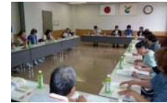
【アンケート結果報告】