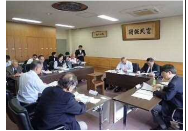
審議している様子

今回の外部評価は平成30年度下半期の業務について、受託者へのヒアリング調査を実施しました。委員からは、外部評価のモニタリングが3年目となる。経営の効率化だけではなく、人を育てるのに寄与していきたい。さらに、市の水道事業が良くなるよう協力していきたいなどの意見をいただきました。