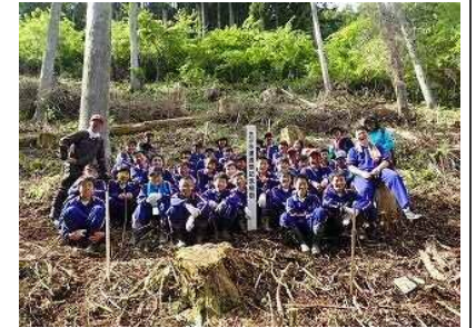
植樹を終え、記念撮影

植樹終了後、生徒代表者より「植樹を行い、私たちは、木に守られていると改めて感じた。いつまでも山を大事にしていきたい」と感想をいただきました。