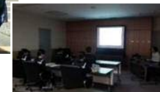
【水道事業について】