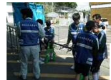
【給水タンクの設置】

今後も、このような事業を積極的に受け入れ、水道事業への理解を深めていただけるよう務めます。