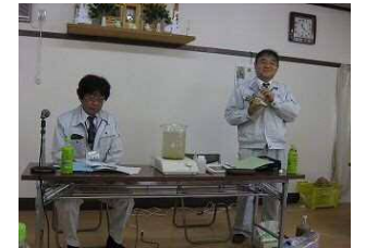
担当職員が説明している様子

5月19日（日）に、新田駅前生活センターにおいて、新田駅前自治会研修会が開催され、職員2名が出席しました。自治会研修会は情報交換、研修等とおして、会員相互の交流を図り、地域の様々な課題に対する認識の共有など、自治会内の円滑化を図るため開催しているものです。今回は水道事業についての研修会を実施し、水道事業の現状や水道管の老朽化している課題などについて研修を行いたいという要望があり講演を行ったものです。参加された皆さんからは漏水の状況や、料金についてなど活発に質問をいただきました。